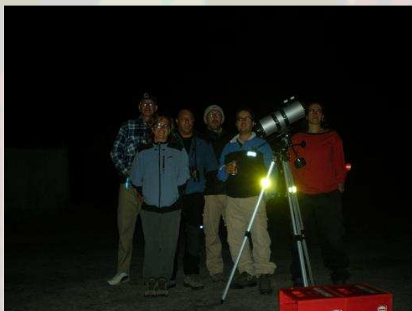
Componentes del grupo de Sierra Nevada

La participación organizada contó con un total de 57 grupos de observación repartidos por la Región de Murcia así como por diversos lugares de España (principalmente ubicados en Andalucía, Comunidad Valenciana, Castilla-La Mancha, Castilla-León, Cataluña, Islas Canarias y Comunidad de Madrid) y algunos países de América (Venezuela, Argentina, Méjico, Costa Rica y Estados Unidos) Irlanda y Australia.