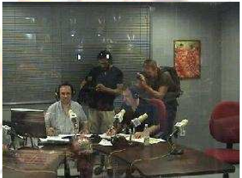
Instante en el que se recoge información sobre un avistamiento

El programa no puede llevarse a cabo sin lo que denominamos “el llamamiento”, que consiste en la lectura de un texto que “invita” a las “luces sin nombre” a dejarse ver. Es la parte poética y soñadora de una experiencia que no persigue otra cosa que unir a muchas personas en una noche cualquiera para observar el firmamento con ojos de niño y contarse unos a otros lo que están viendo; o lo que están viviendo.