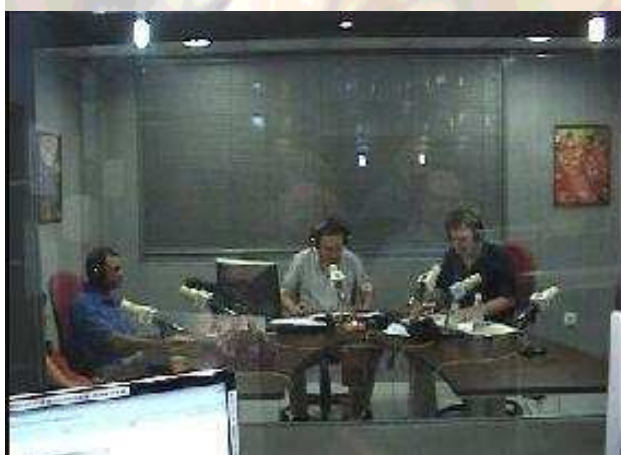
Instante en que comienza el programa, en el estudio 1 de O.R.

Las casi tres horas que duró el programa fueron inolvidables. A un ritmo vertiginoso se fueron sucediendo conexiones con grupos de vigilancia, entrevistas con expertos y llamadas de oyentes que nos comunicaban sus experiencias.